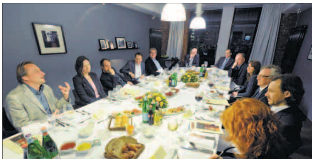
Eine muntere Diskussionsrunde über Protestkultur im Vorstandszimmer des Hotels „Gastwerk“

Redaktion: Axel-Springer-Platz 1, 20350 Hamburg, Brieffach: 0719 Telefon: 040 - 347 - 24333 Fax: 040 - 34 55 14 Anzeigen-Tel: 040 - 347 - 27386 E-Mail: hamburg@welt.de Internet: welt.de