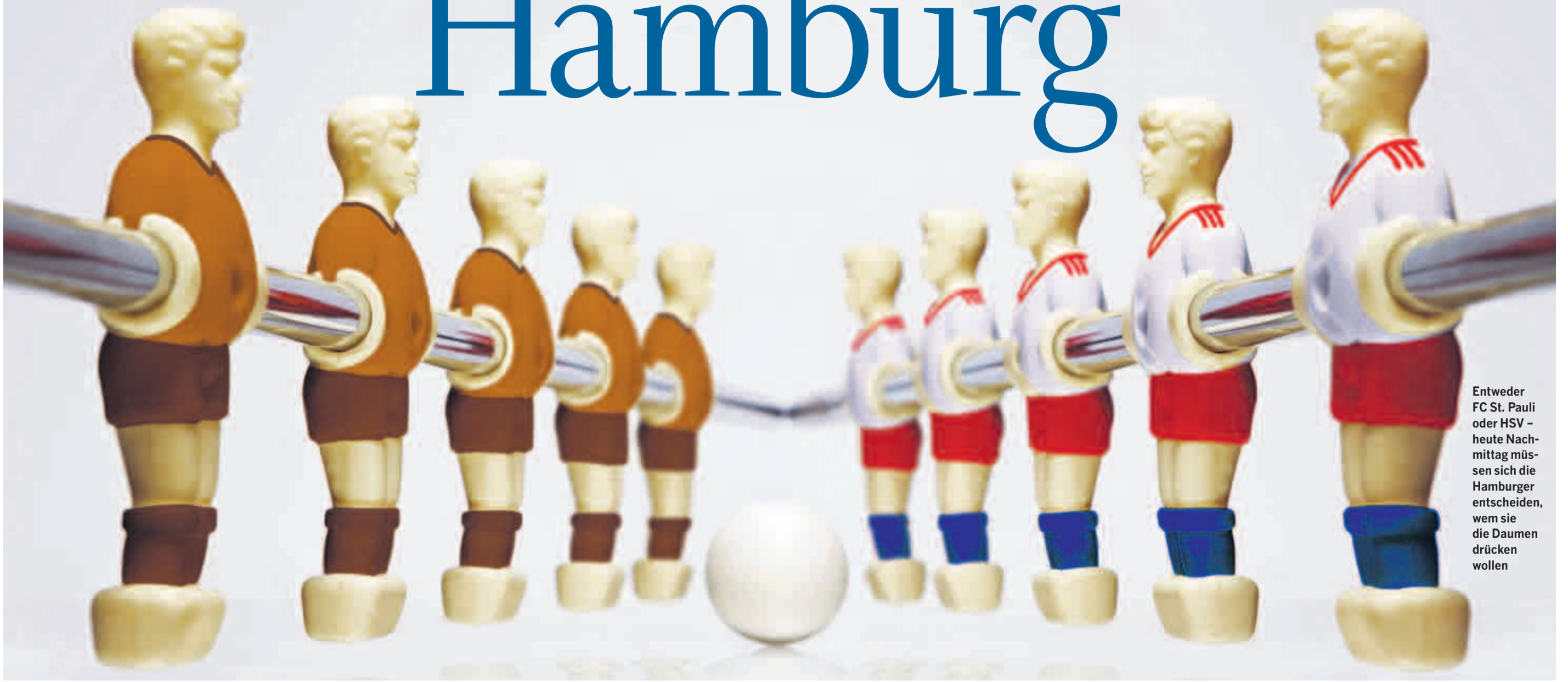
Entweder FC St. Pauli oder HSV – heute Nachmittag müssen sich die Hamburger entscheiden, wem sie die Daumen drücken wollen